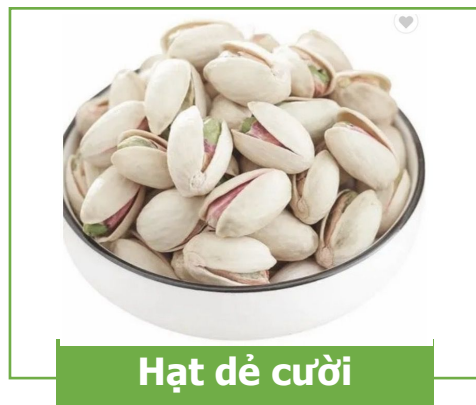
Hạt dẻ cười